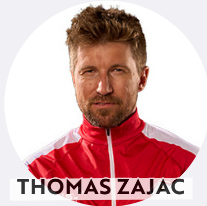
THOMAS ZAJAC TEAMCAPTAIN & STEUERMANN

Olympics 2016 Rio - Bronze-Medal , Olympics 2020 Tokio participant, 2. Platz Tornado WM 2009; 2. Platz M32 WM 2017; 2. Platz Topcat Worlds 2011